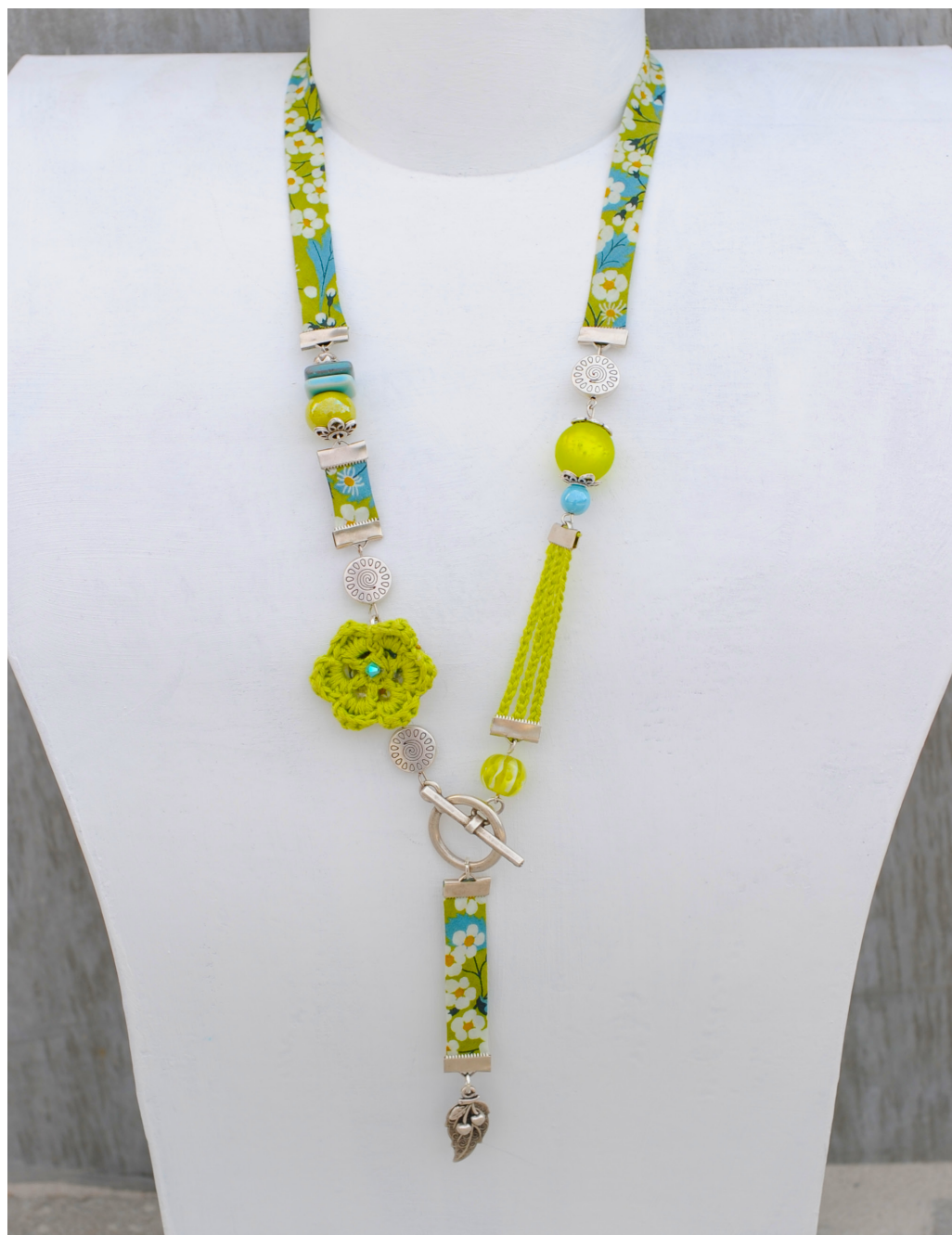
Collier printannier Biais Liberty© ,perles, métal et crochet